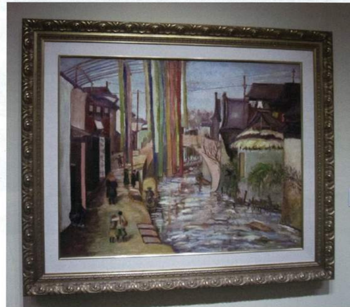
陳澄波 蘇州 1929 油彩畫布 89.4×115.5cm 台北市立美術館藏