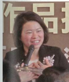
嘉義市長黃敏惠致詞