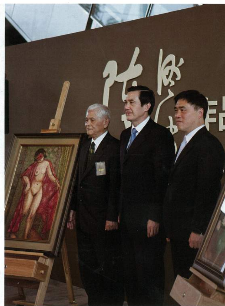
陳重光與總統馬英九、台北市長郝龍斌合照

二二八事件是台灣歷史中的一個不幸悲劇，有她特殊的時代背景和歷史無奈，而僅以「政治受難者」的角色來認識陳澄波，顯然是不夠公平的。歷經三代人的含冤、忍辱、保存，陳