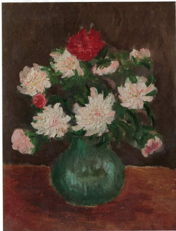
陳澄波 紅與白 油彩畫布 51×39cm