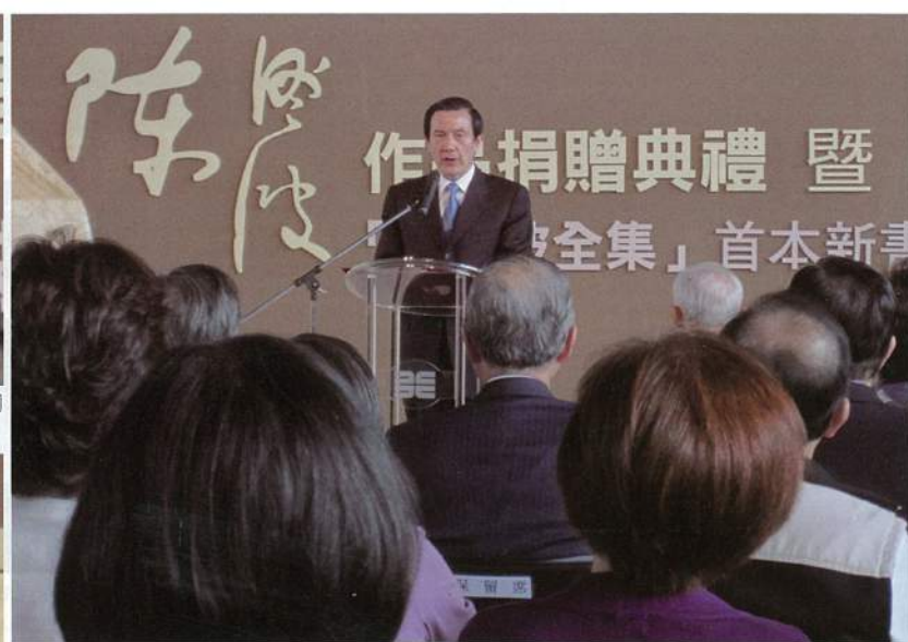
馬英九總統在《陳澄波全集》首本新書發表會上致詞