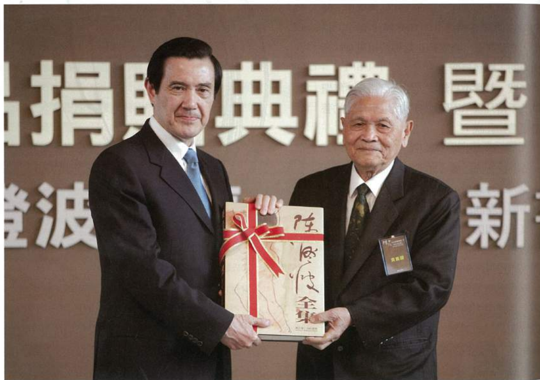
陳重光在典禮上將《陳澄波全集》「第三卷·淡彩速寫」贈予總統馬英九

財團法人陳澄波文化基金會與中研院台史所策畫發行、藝術家出版社出版的《陳澄波全集》新書發表會於3月29日在台北市立美術館舉辦，會上除宣布《陳澄波全集》「第三卷·淡彩速寫」出版，北美館也與陳澄波文化基金會共同舉辦畫作捐贈儀式。總統馬英九、台北市長郝龍斌、嘉義市長黃敏惠、陳澄波文化基金會董事長陳重光、中研院台史所所長謝國興、北美館館長翁誌聰以及成功大學教授、同時也是《陳澄波全集》總主編的蕭瓊瑞均出席典禮。