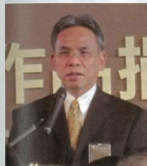
中央研究院台灣史研究所所長謝國興致詞