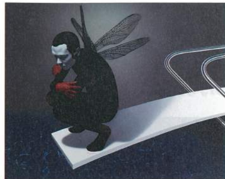
林宏信《迴身之地I》，油彩、丙烯、畫布，182×227cm (150F)，2012。

林宏信的作品在作法上較接近1960年代被統稱為「敘事性具象」的法國畫家們，如翰西亞克(Rancillac)、雅猶(Emile Aillaud)、貴柯(Henri Cueco)、克拉森(Peter Klasen)、赫卡卡提