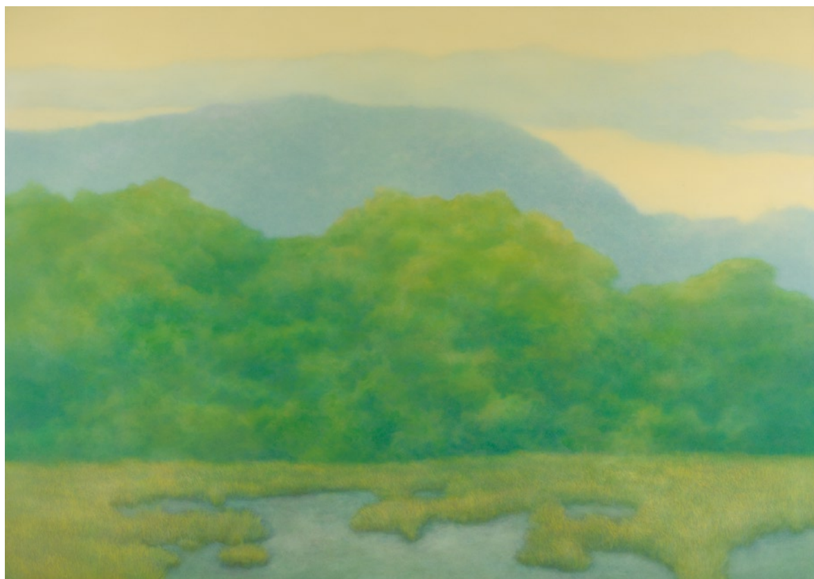
林煒翔 晃遊 (一) 油彩畫布 162×227cm 2009

林煒翔於2005年至2006年間，逐漸找到一個觀看山水的角度與新觀點，他嘗試在精細寫實的風景作品上使用朦朧化的處理手法，刻意模糊所有自然元素的輪廓與邊界，巧妙地將寫實的樣貌轉換為非現