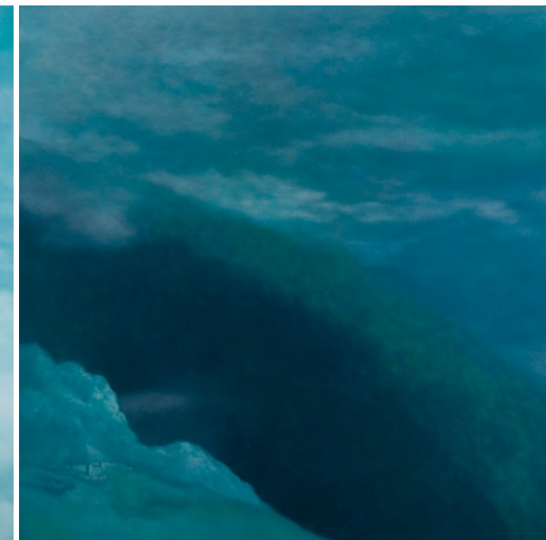
林煒翔 靜心亭（二） 油彩畫布 170×170cm 2009