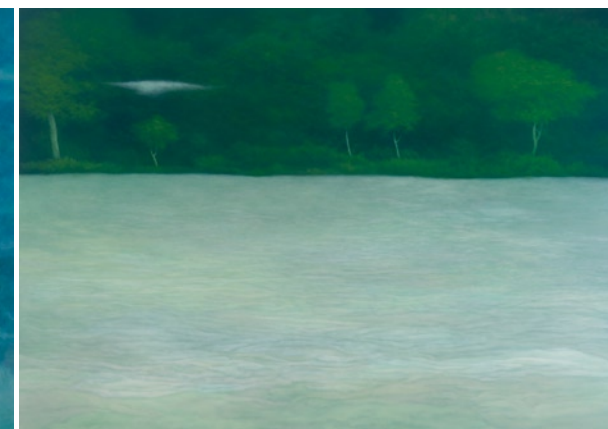
林煒翔 晃遊 (四) 油彩畫布 162×227cm 2009

實的狀態，開啟一道通往神祕與幻想的精神空間。2007年至2008年的「遊蹤」系列作品，更進一步精簡畫面中的風景角色，單純地僅描繪一處山嵐、一個靜默的湖泊或一片雨後的森林，然後，明確地以一朵雲做為自我的象徵，寄託他對自然的嚮往與傾慕；透過雲和雲的造形，傳遞自身在日常生活中與大自然交往、親近與對話的真誠體驗。此時的作品