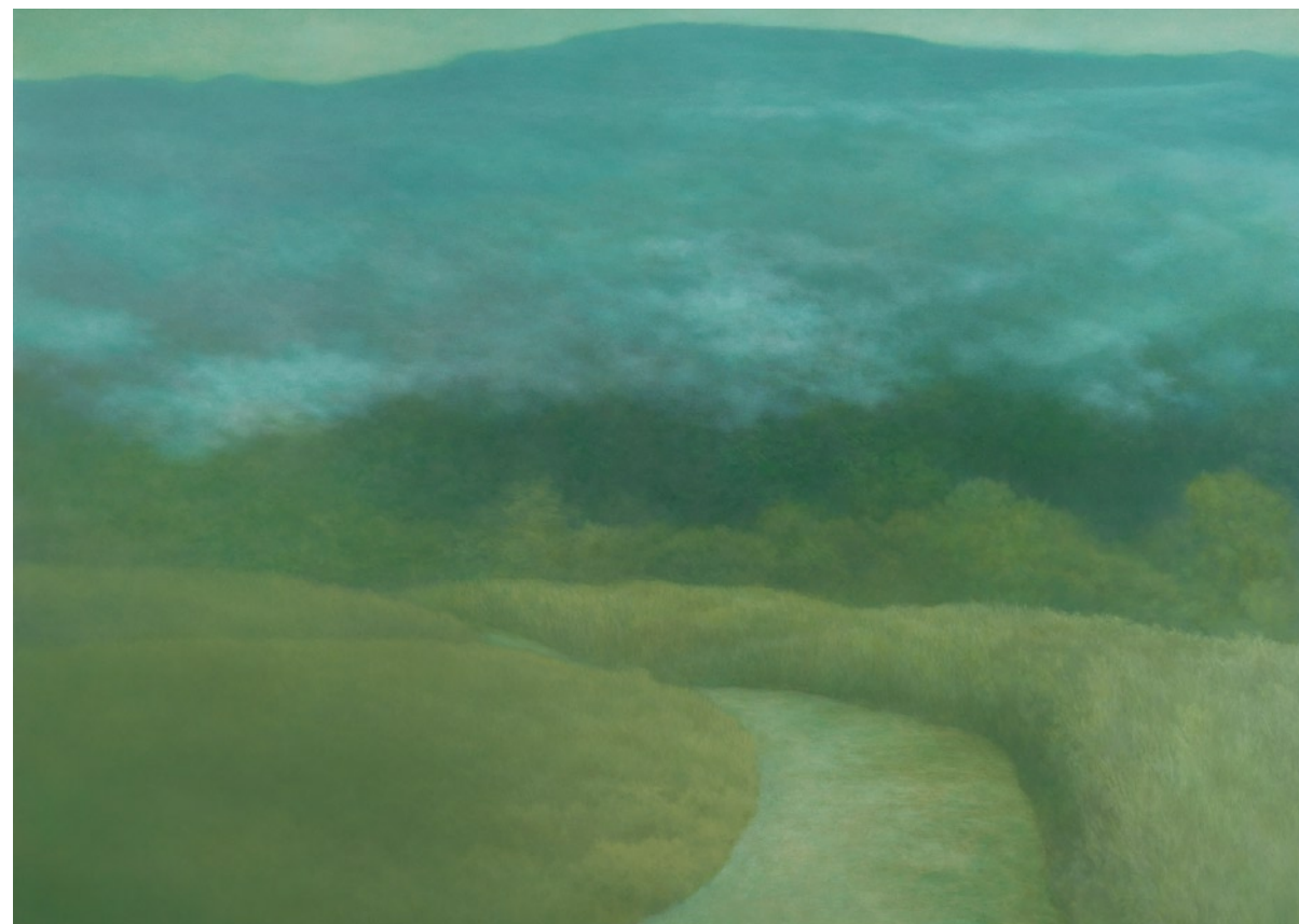
林煒翔 晃遊 (三) 油彩畫布 162×227cm 2009