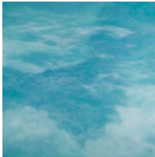
林煒翔 靜心亭（一） 油彩畫布 170×170cm 2009

織出完整的作品，只要這二者傳達的訊息足夠，就能充分表達創作者主觀的各種感受。如同林煒翔的作品想傳達投遞的漫遊情緒與移動感，不僅僅來自那些存在於瞬間凝止與緩步移動之間的雲朵，同時亦來自於感懷時間變化的藝術家意志。在他的作品中，看得到觀念與技法並重，也感受得到創作的真誠態度，因此，判讀他的作品不需要套用複雜或淵博的藝術理論，只要敞開心胸、靜心去看，即能獲得藝術家全心給予觀者的心靈贈禮。