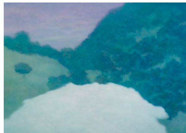
林煒翔 晃遊 (二) 油彩畫布 162×227cm 2009