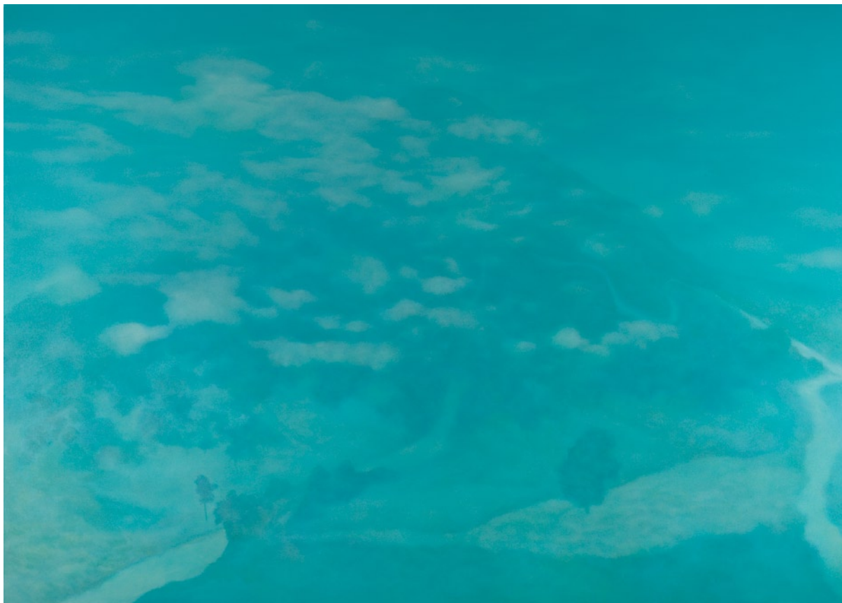
林煒翔 晃遊（五） 油彩畫布 162×227cm 2009