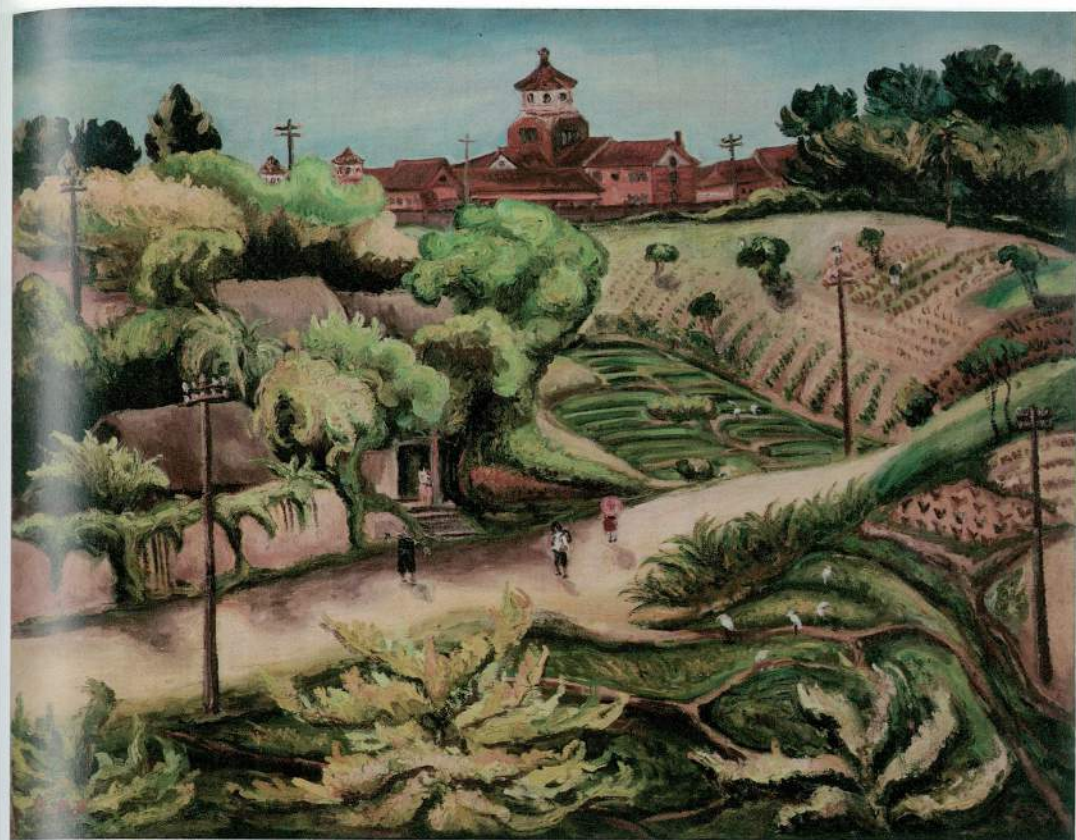
陳澄波 澗(淡水中學) 1936 膠彩絹 90×116.5cm 私人藏