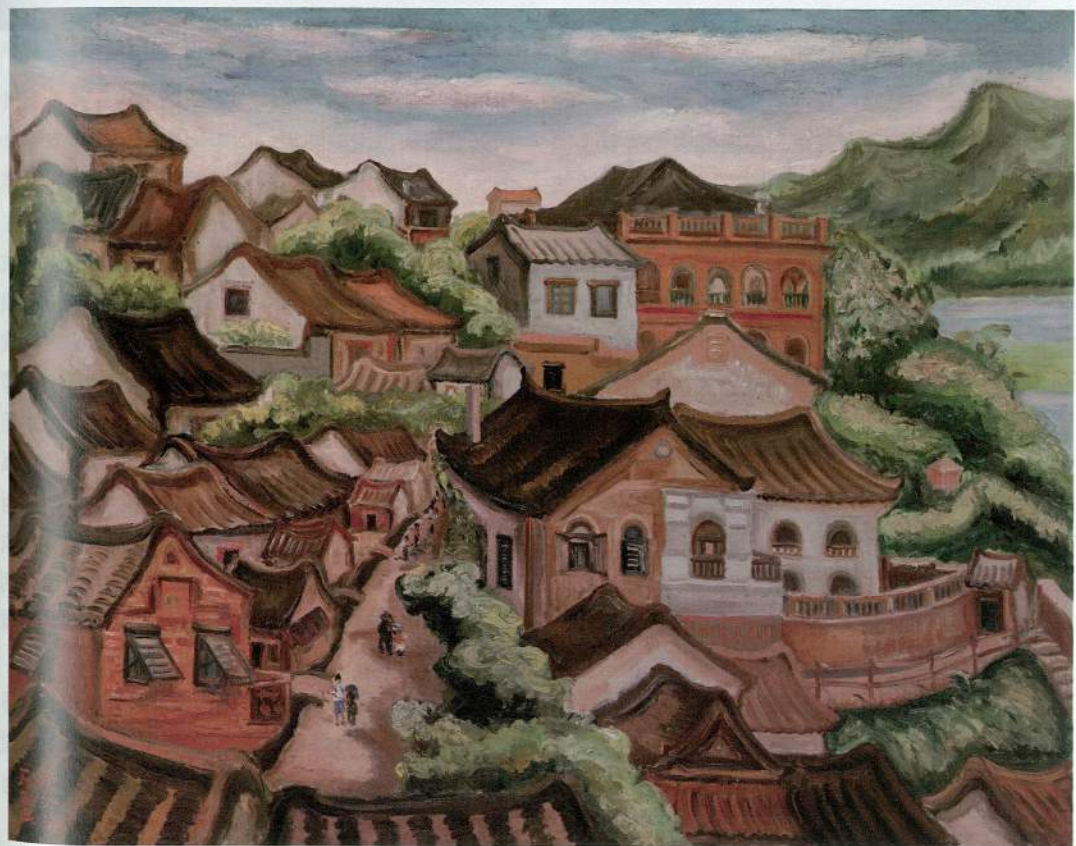
陳澄波 淡水風景 1935 油彩畫布 89×115cm 國立台灣美術館藏