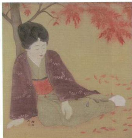
陳澄波 沉思 1926 膠彩絹 126×111cm 私人藏

參觀嘉義市政府文化局時，看到陳澄波留日期間節衣縮食，省下生活費，收購為數甚多與美術有關的明信片、美術圖片、書報雜誌，除了做為自我充實畫藝所需，也期能做為教育後輩之用，因此，陳澄波也可稱為是教育學者。從他的遺書及明信片文字，充分感受到他對社會、對民族、對畫壇及家人