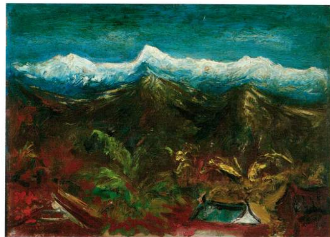
陳澄波 玉山積雪 1947 油彩木板 23.5×33cm 私人藏

的不同面向舉辦論文研討會，並出版論文集，希望帶動更多的觀展興趣，讓藝文愛好者認識不同角度的陳澄波。而出版論文集除了留下歷史文獻之外，也將做為日後的研究參考史料。