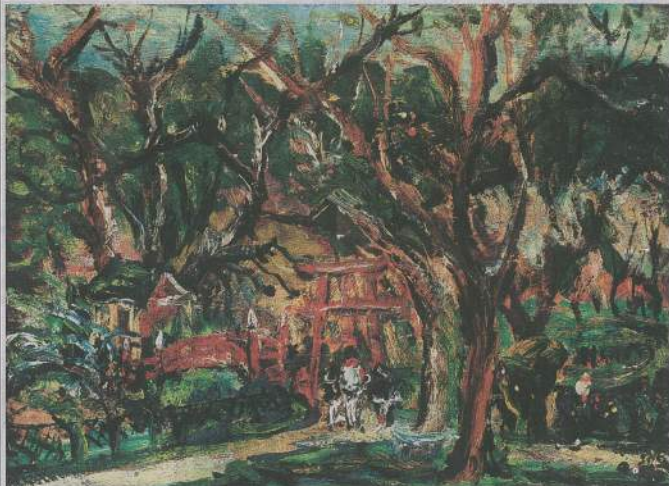
▲《嘉義公園(四)》，油彩繪花木板，22.8x33cm，1938年。

成功大學歷史系教授蕭瑞琦指出，大家對陳澄波的了解，不該只是228事件受難者這角度，應該重新肯定他的藝術成就。他把西方油彩畫出東方特色，比中國徐悲鴻、林風眠更早在東西融合課題上做出成績。