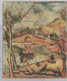
▲陳澄波生前最得意的作品《清流》，描繪西湖殘雪，油彩，72.5x60.5cm，1929年。