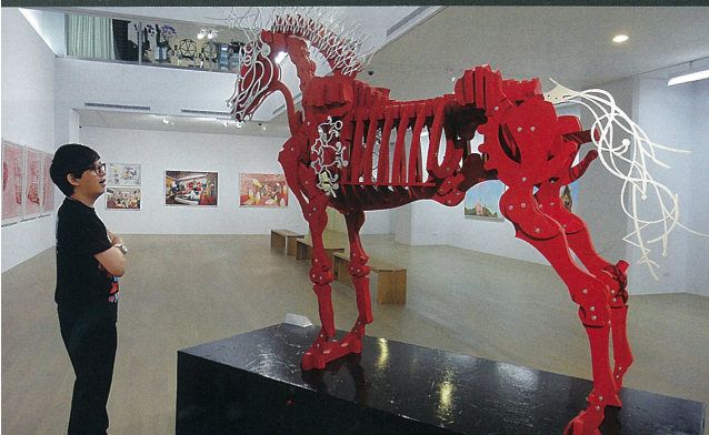
席時斌在2011 ART TAIPEI展出的木紅馬，也在尊彩藝術的「台灣囍遊記」聯展中現身。