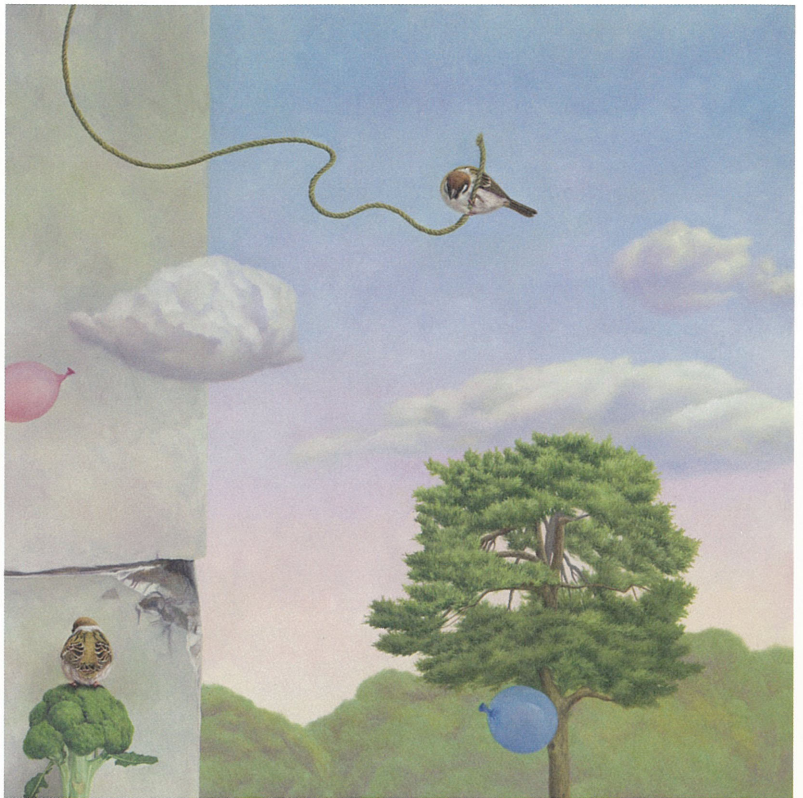
〈未知的遠行〉 油彩、畫布 100×100cm 2012