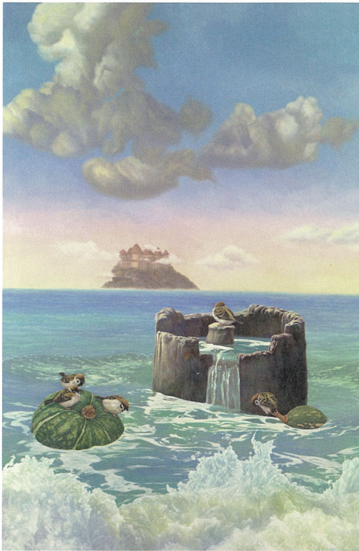
〈另一個童話的開端〉 油彩、畫布 175×115cm 2012