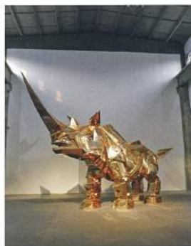
施力仁《金鋼犀牛》 鋼 888×220×458cm 2014