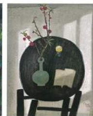
董小蕙〈初春—杏花II〉 油彩、畫布 91×72.5cm 2014