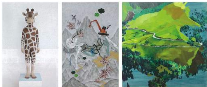
小泉悟 (Satoru KOIZUMI) 《Animal human Giraffe》Woodcarving、Pigment、Resin 109.5×33×33cm 2014