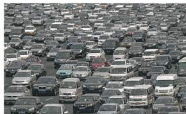
王子〈歡樂時光〉 照片 70×100cm 2013