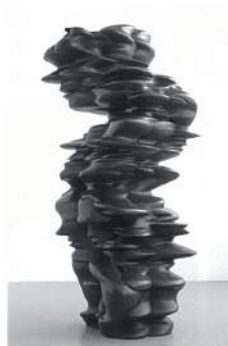
克雷格(Tony CRAGG) 《是耶非耶》(It is, it isn't) 青銅 242×120×100cm 2010