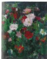
王守英〈虞美人〉油彩、畫布 65.5×53cm 2014