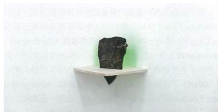
Alexandre MAUBERT〈Accident #vert〉 Black marble, green lacquer, wood 30×30×27.5cm 2014