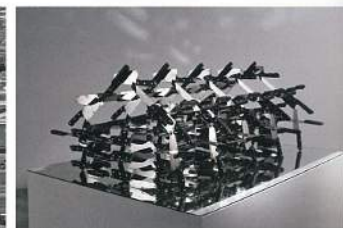
吳建興〈同心圓—小圓〉 裝置 102×145×60cm 2014