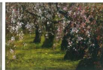
蘇憲法〈櫻花飄曳的早晨〉 油彩、麻布 80×116.5cm 2014

致力於推廣台灣本土優秀藝術家的國泰世華藝術中心，於2014 ART TAIPEI邀請到王守英、蘇憲法與董小蕙三位本土優秀的藝術家共同展出，此展同時以「澄懷·映物」為名，期能彰顯三位參展藝術家在創作上所展現之藝術態度與美學實踐，也表藝術上所追求的高度精神境界。