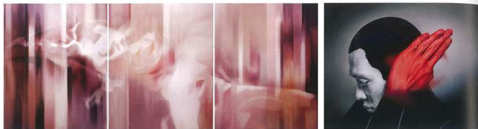
王建文《Metamorphose》油畫 162×390cm 2014