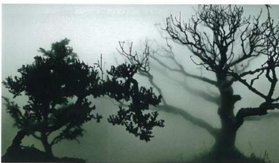
吳季璁〈煙林墨之一〉單頻道錄像 10分17秒 2012

近年來，藝術市場內的鎂光燈屢屢隨著「新水墨」風格作品移轉，在這些乍看傳統骨架下或東或西隱含著當代思維的作品中，每每讓人思考是否在題材、媒材、技法變形下，東方的傳統思維能有所延續和發聲，亦或是帶來一絲新意讓人重新體會。於2014台北藝博，耿畫廊集結了楊茂林、姚瑞中、陳浚豪、彭薇及蘇孟鴻等藝術家展出；作為耿畫廊當代藝術平台的TKG+則推出蔡佳蕙及吳季璁的作品，多位藝術家在媒材的轉換上不約而同延續傳統水墨的精神，重新詮釋當代水墨的新語彙，並各自演繹其東方哲學。