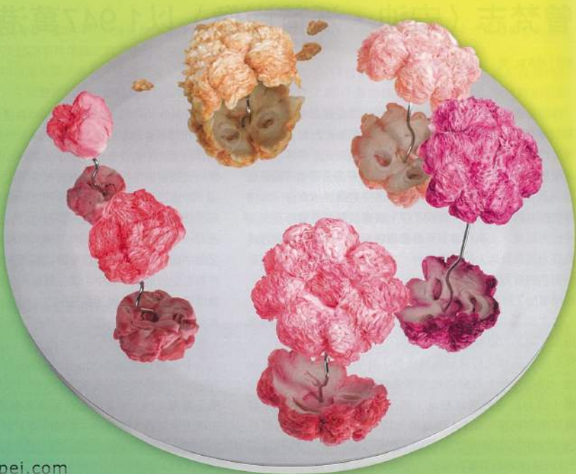
徐薇蕙 (生命之花——笑迎人生) 複合媒材 直徑90×30cm 2014

2014台北國際藝術博覽會(2014 ART TAIPEI)訂於10月31日至11月3日假台北世貿一館舉行,今年以「Dear Art,」為主題,以信件的书寫為開頭,強調每個人都可以和藝術建立屬於自己的關係,不論從哪個角度來看:創作者、鑑賞者、詮釋者或收藏者,藝術都是讓我們能和自己內心純粹對話的不二媒介,透過藝術品,我們可以了解自己、同時了解彼此、進而了解我們所處的環境,以及這個世界。