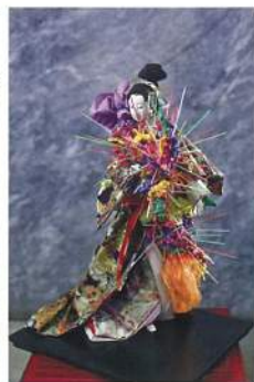
Miguel AQUILIZAN《Discordant 1》 Fabric、Wood、Synthetic Hair、 Plastic、Found Objects、Semi- Precious Materials 41×23cm 2014