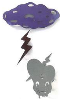
Mariano CHING《Levitare Me》 stainless steel galvanized iron sheet variable dimension 2008