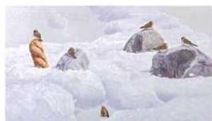
黃頤勝《通往嚮往的路徑》油彩、畫布 75×132.5cm 2014

尊彩藝術中心即將展出林宏信、黃頤勝、胡朝聰、王建文、蔡潔莘、吳耿禎、徐薇蕙等七位台灣當代藝術家。