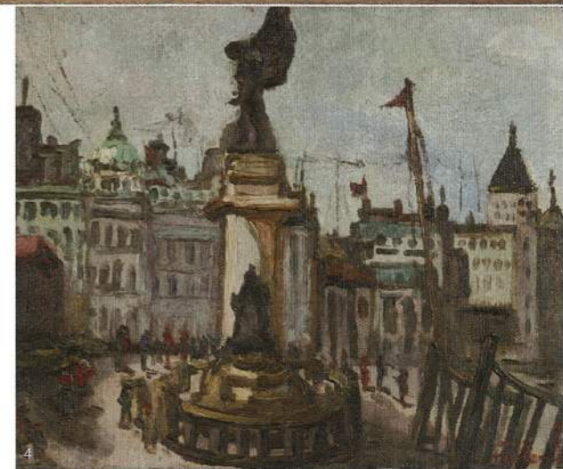
1.〈貓鼻頭〉，2008年香港蘇富比拍賣，估價港幣2,500萬元。 2.〈上海碼頭 (渡口)〉，1933年，油彩畫布。3.〈夏日街景〉，1927年，油彩畫布，本畫於2002年被郵政總局選為發行「台灣近代畫作郵票」。4.〈上海碼頭〉，1932年，油彩畫布。

從他立志學畫的動機，不難看出「畫我故鄉」是日據時代能替台灣發聲的方法之一，特別是他選擇故鄉嘉義作為繪畫主題，連續兩年入選「日本帝國美術展覽會」，也成為他一生繪畫的最大特色。在風景畫當中，可以看得出來他如何從早年求學時所學會的水彩技巧，在日本東京美術學校所學會的西方油畫技巧，以及在上海任教期間又受到傳統水墨畫作的影響，融會貫通成為他個人的風格。他所提出的「隱藏線條於擦筆之間」繪畫手法，利用油畫顏料所具的黏稠和延展性，以厚塗著色、讓畫筆藉由擠壓顏料的手法，留下筆觸。讓筆觸呈弧形方式連續進行，運筆劃過濃厚的顏料、產生筆觸的痕跡，兼顧擦筆的效果之餘，得以讓線條隱約存在。在他所繪製的樹林、盪漾的水面，都不難察覺到此技法。風景畫的取材，不光只有大自然，他對於市井生活的觀察，一樣纖細入微。無論是電線桿、雕像、高樓、鐵橋等等當代都市的景象，反映出從定點平視的角度，改變為環顧周遭的視點。