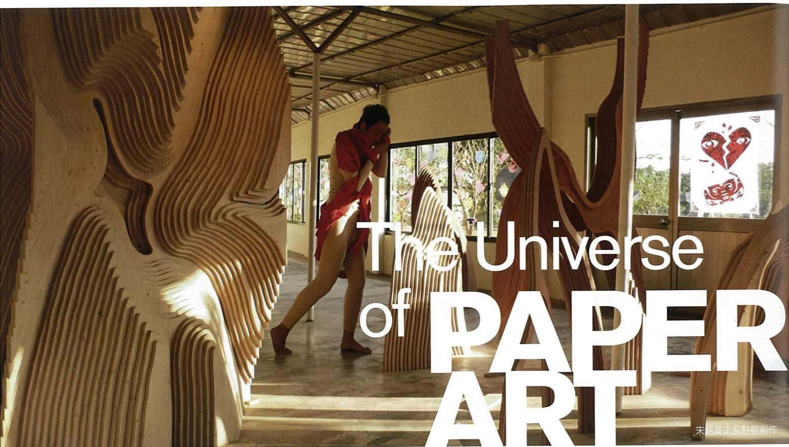
朱銘美術館駐館創作