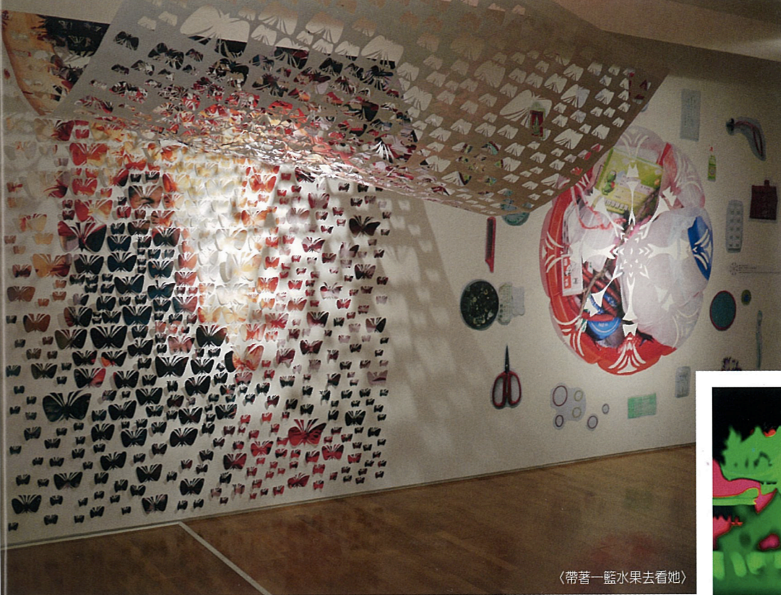
〈帶著一籃水果去看她〉