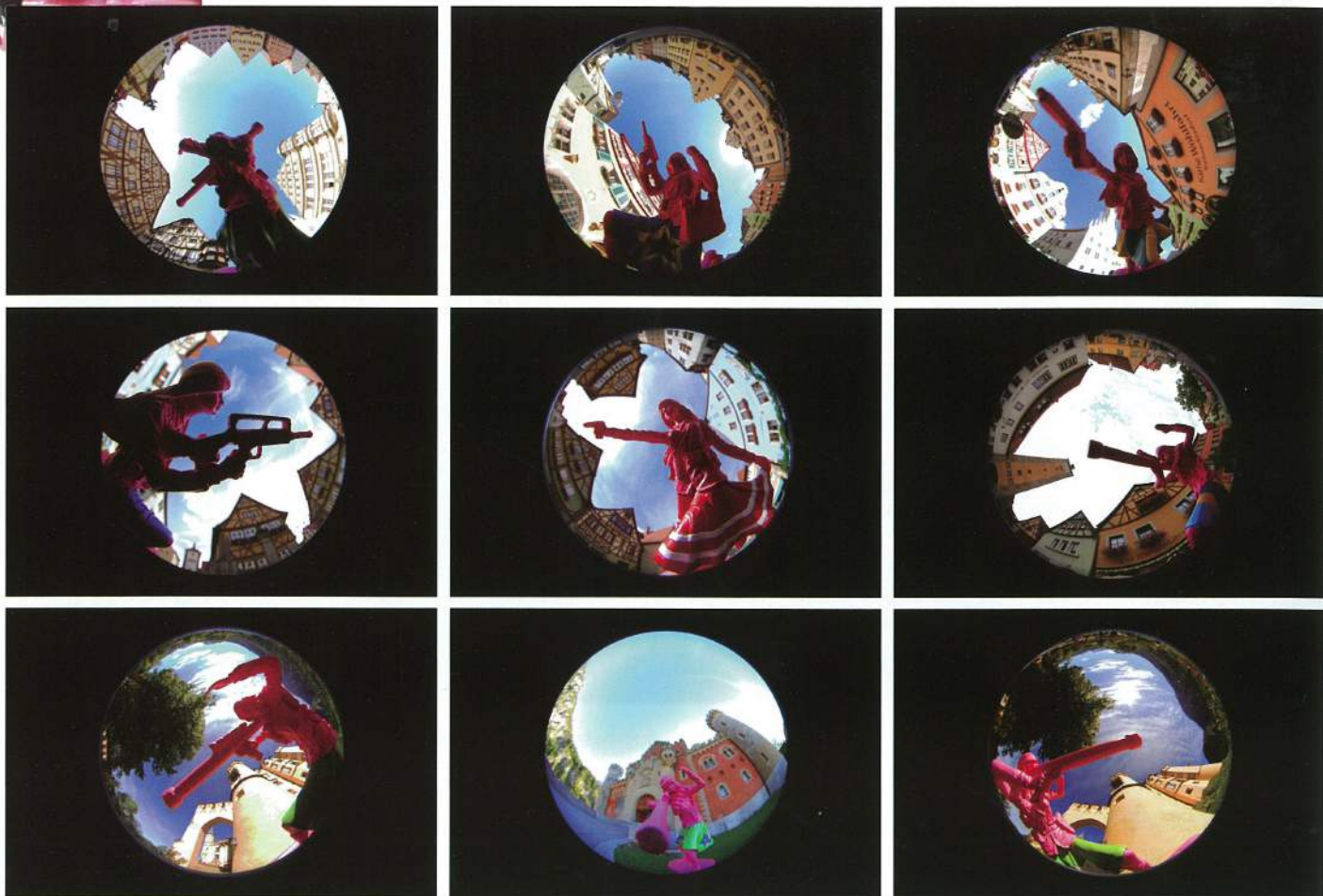
徐薇蕙 游擊女孩—童話幻境 1-9 攝影輸出、水晶裱 直徑50-80cm不等 2012