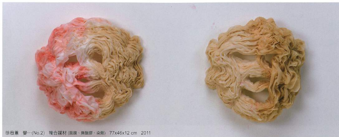
徐薇蕙 變…(No.2) 複合媒材(面膜、無酸膠、染劑) 77x46x12 cm 2011