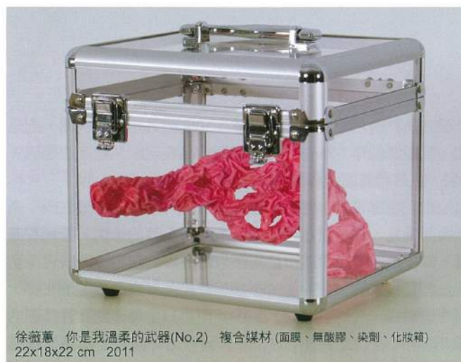
徐薇蕙 你是我溫柔的武器(No.2) 複合媒材(面膜、無酸膠、染劑、化妝粉) 22x18x22 cm 2011