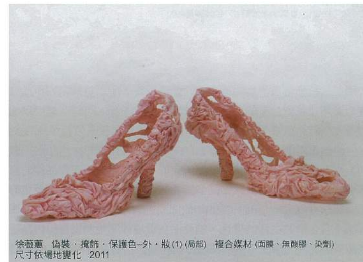
徐薇蕙 偽裝·掩飾·保護色—外·妝(1)(局部) 複合媒材(面膜、無酸膠、染劑) 尺寸依場地變化 2011

最為難得的是，她並沒有一味地耽溺在對於光暈形而下「實體」的琢磨，當她後來慢慢發展出自己廣被眾人認識的《面膜系列》、《游擊女孩系列》作品時，徐薇蕙慢慢解構了光暈存在實體化，我很意外的發現她竟然能夠讓抽象及毫無量體的光暈，首度在《面膜系列》作品中出現了「量感」，而這樣的「量感」更也隨著她一次又一次的嘗試和實驗之後，讓早期《潛在因子系列》作品裡面所出現的光暈，已經不再只是靠著光的或淡或強來主導情緒的解讀，她反而讓這樣的「質感」因為對於面膜的染色與堆疊，來轉換與銜接份源自於早前「光暈的質感」，進而成就出現階段作品所展現的「生命的體感」。從抽象到具體，這並不意味著藝術家在語言的操弄著趨近於入世，我反倒覺得；這是藝術家愈來愈懂得經由簡單樸素的話語來陳述深刻的內在風景，這就好像普魯斯特所講的，去除掉種種影響，回到心中未知的深處。