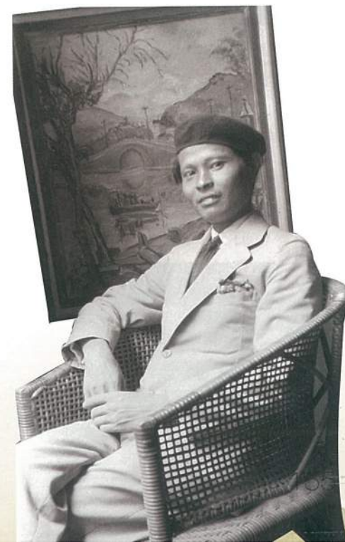
陳澄波攝於上海，背景作品為《清流》。

所謂人生朝露，藝術千秋。陳澄波百二誕辰東亞巡迴大展是一個美好的開端，期許日後有更多歷程是藉由藝術書寫與記載。■