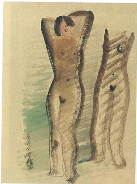
左 《立姿裸女-32.1 (24)》·紙本淡彩鉛筆·36.6×26.5 cm·1932。上海時期提供陳澄波探索現代藝術的最佳環境，尤以淡彩裸女系列為一大嘗試；非視覺再現的主觀表現，帶有線條與色面的前衛探索。