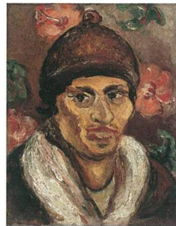
左 《自畫像》，畫布油彩，41×31.5 cm，1928。 右 《自畫像》，畫布油彩，41×31.5 cm，1930。

適逢陳澄波百二誕辰，讓我們得以看到一個藝術家的成功絕非偶然，傑作也並不是在畫布前即興揮灑而成，係在動筆之前下過無數的苦功堆疊而成。陳澄波近30歲才赴日本東京美術學校就讀，起步較晚的他更加努力地填補落後的繪畫資歷。在學校的訓練之外，他大量蒐集帝展等展覽作品的明信片作為參考，數量之多連日本學者都相當敬佩。而透過家屬悉心保存