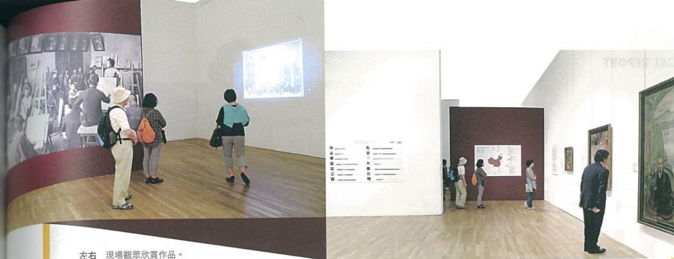
左右 現場觀眾欣賞作品。