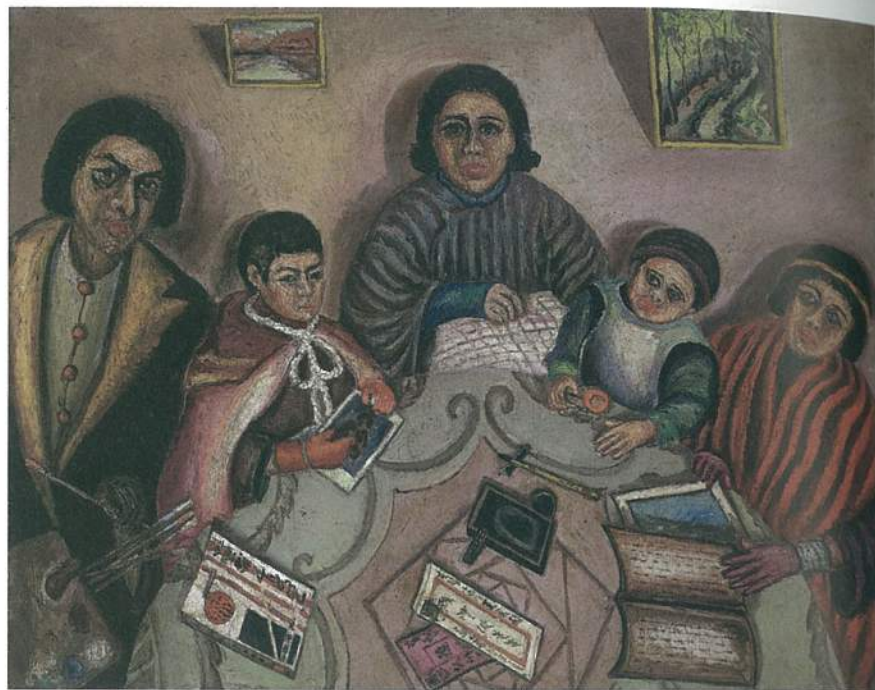
《我的家庭》，畫布油彩， 91×116.5 cm · 1931。

的照片、書信等文件，可以看到陳澄波始終和美術啟蒙教師石川欽一郎保持書信連絡，向其請益創作方向與作品評論，除了感受到他對恩師的感念與尊敬，還有對藝術的追求不怠；而他與當時藝術家頻繁的交往與切磋，在在成為他探索更多藝術表現可能的正向資源。