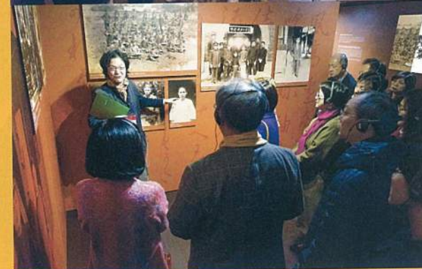
觀眾仔細聆聽導覽人員說明。