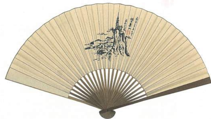
《山水扇面》·紙本水墨·22.5×40 cm·1946。 此為陳澄波以嘉義參議會議員身分，前往台南東山作民眾服務時所繪，扇面可見傳統山水構圖，顯示他未曾停止中國式繪畫的創作。