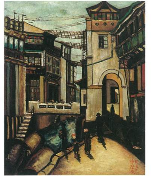
右 陳澄波《上海陸橋》，油彩畫布，40F，1930。以黑色輪廓線勾勒，是陳澄波在上海時期受到中國傳統繪畫影響的特色。