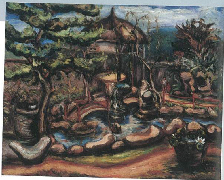
左 陳澄波《西普芳》，油彩畫布，50F，1932。西普芳為嘉義知名酒樓，從點黑人物的服飾能夠看出當時台灣社會的多元面貌。 右 陳澄波《琳瑯山閣》，油彩畫布，30F，1935。琳瑯山閣為嘉義才女張李德和的宅邸園林，可見恣意流暢的線條。

自2014年開始巡迴的陳澄波跨國展覽，主辦的陳澄波文化基金會在過程建置了全面完整的學術根基，更擴充還原了與陳澄波生活在同時期的藝術家以及大環境發展面貌，淹沒在戰爭煙硝下的破碎歷史逐步重現拼組，對台灣、中國大陸與日本藝術界都提供了相當重要的貢獻。綜合以上考量，陳澄波，作為一位出生於十九世紀末的台灣藝術家，在他最為活躍的1930年代，也正是亞洲亟於尋求自我核心價值與西方藝術抗衡的時期，他流轉於日本、中國大陸與台灣，在各地吸取養分並結出豐美的果實，在地性與國際觀在他的創作歷程中並行無礙，其人其畫之於亞洲戰前藝壇發展的推進力量不容小覷。而陳澄波極具個人表現風格的作品，看似奔放恣意，然技法與用色觀念卻相當嚴謹純熟。這些應驗了藝術家的紮實功力，也顯示出陳澄波藝術歷久彌新的深厚價值。