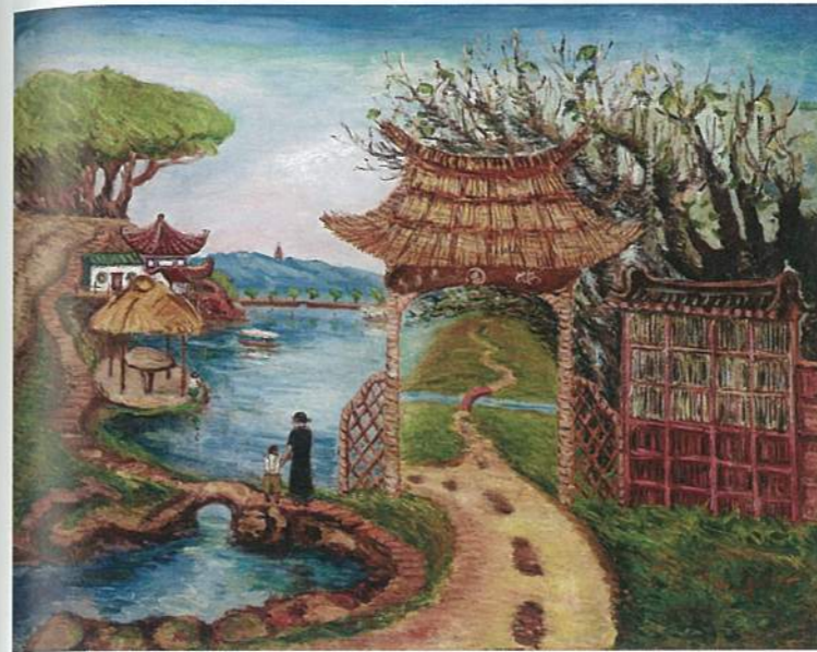
左 陳澄波《梅園》，油彩畫布，50F，1930。一河兩岸的構圖、散點透視構圖、軟筆線條描繪樹枝，具有中國傳統繪畫特色。

為了讓《典藏投資》的讀者比其他人早一步了解此屆參展的藝術狀景，特從「畫廊薈萃」(Galleries)、「亞洲視野」(Insights)、「藝術探新」(Discoveries)、「藝聚空間」(Encounters)、「光映現場」(Films) 五項聚集了歐、美、亞、非四大洲約260家畫廊帶來的數千位藝術家的作品中，點選台北、北京、上海、香港、紐約等城市的畫廊精華，籌謀一場「紙上大觀」，讓讀者人還沒到香港會議展覽中心，就已領略其內涵與風采！