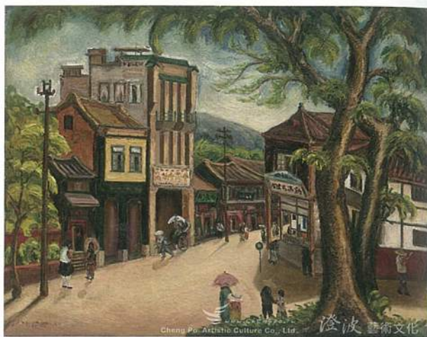
陳澄波《嘉義街景》·畫布、油彩·91×116.5 cm·1934。