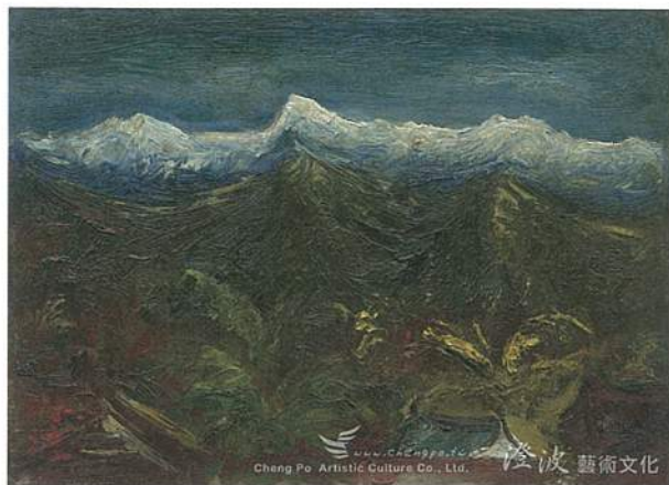
陳澄波《玉山積雪》·木板、油彩·23.5×33 cm·1947。

在這樣藝術史上重要的2014年，也正值一生最具傳奇性色彩、台灣前輩畫家一陳澄波的百二冥誕，在東亞巡迴大展（除了台灣台南與台北故宮博物院、在有東亞三大館之稱的「上海中華藝術宮」、「北京中國美術館」、「東京藝術大學」盛大展出）開展的同時，財團法人陳澄波文化基金會獨家授權委託澄波藝術文化有限公司，將透過藝術微噴的發行，持續宣揚陳澄波筆下的