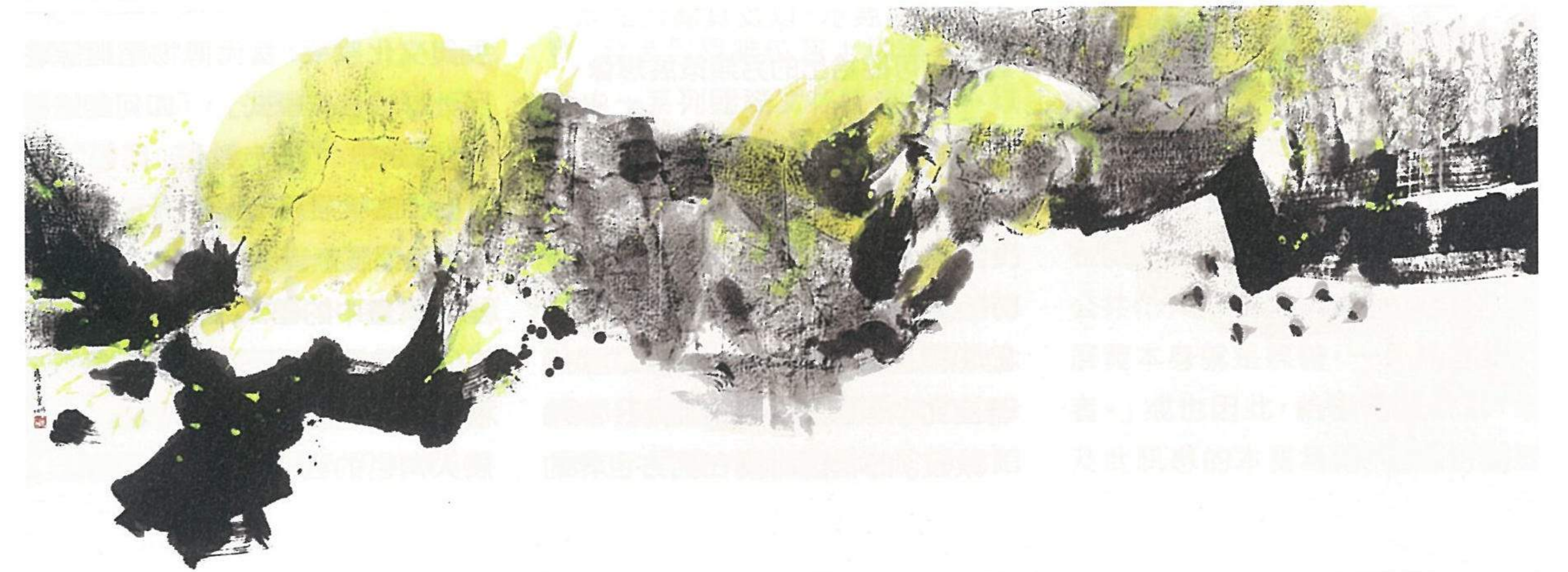
李重重 | 清境 水墨設色、紙本 94.5x250cm 2015

而李重重如何看待「當代水墨」議題的意涵？她闡述國際化是難以避免的趨勢，她以著衣來譬喻：人們不再穿著繡花鞋與馬褂，現代化衣著趨於簡練，人的審美也會跟著挪移，「人就是看你的型、穿你的衣服，看你的時代，這是很自然的狀態，藝術形式也一樣會漸次的更迭。」但並非表示其放棄傳統，傳統的質量已是她繪畫中蕊核的部分。她的繪畫實踐即便一開始是師承林克恭的西畫課程，油彩的凝重與其美感有所距離，仍難掩其性情中對於穿透、流動的傾愛，再由西畫轉到水墨畫的研探。水墨本身文化的厚度，更豐厚地援助其創作表現，像其在墨色的使用上，即便使用壓克力顏料的鮮黃，仍會添入墨色，「所有顏色添點墨就比較雅韻一點，不會那麼有火氣，若不加墨色會比較跳，也會比較悶室。」又如在四聯屏的《景》中，她營造與傳統聯屏連續閱讀差異的敘事，切割了畫面的連貫性，讓畫面成為有如高低聲響的音景，讓敘事斷層建立在傳統敘事上，溫馴的叛逆，是屬於李重重的當代詮釋。