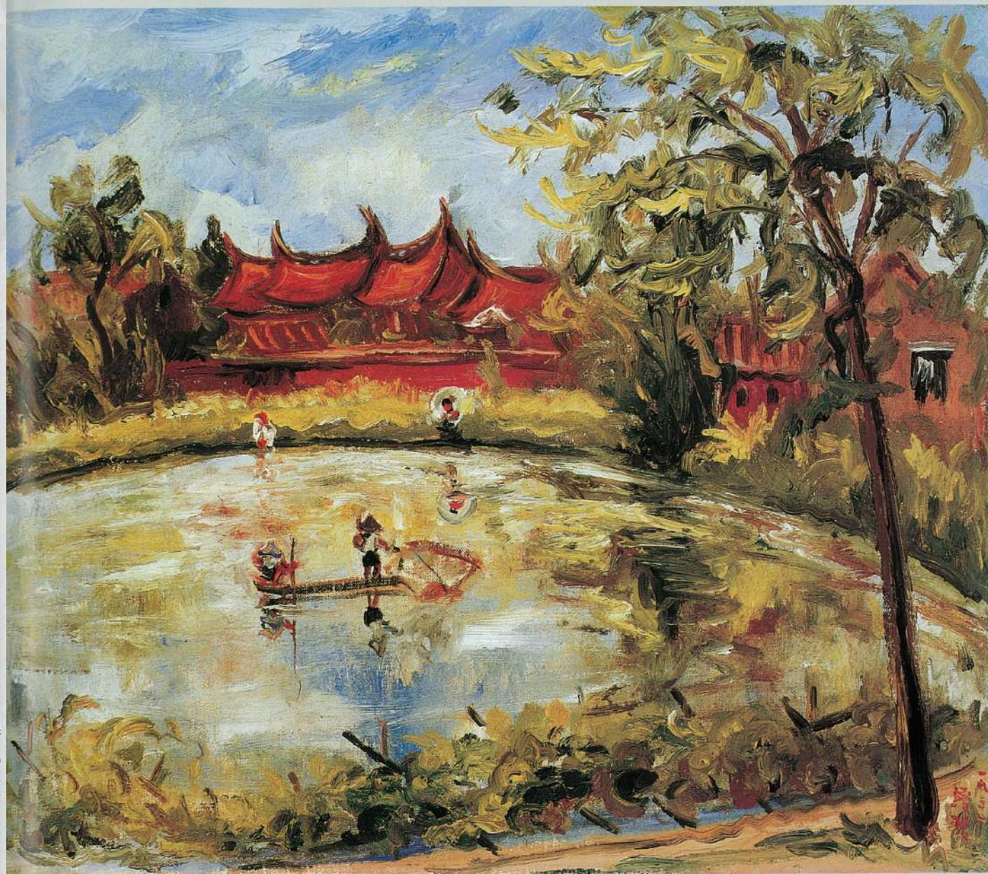
● 陳澄波 西香芳 油彩、畫布 50F 1932 ● 陳澄波 台灣農家 油彩、畫布 10F 1932 ● 陳澄波 琳瑯山閣 油彩、畫布 30F 1935

陳澄波的「敢畫」，最主要呈現在題材的選擇方面，在當時的普遍的「西洋想像」和「有意的異國風情」之外，很豪