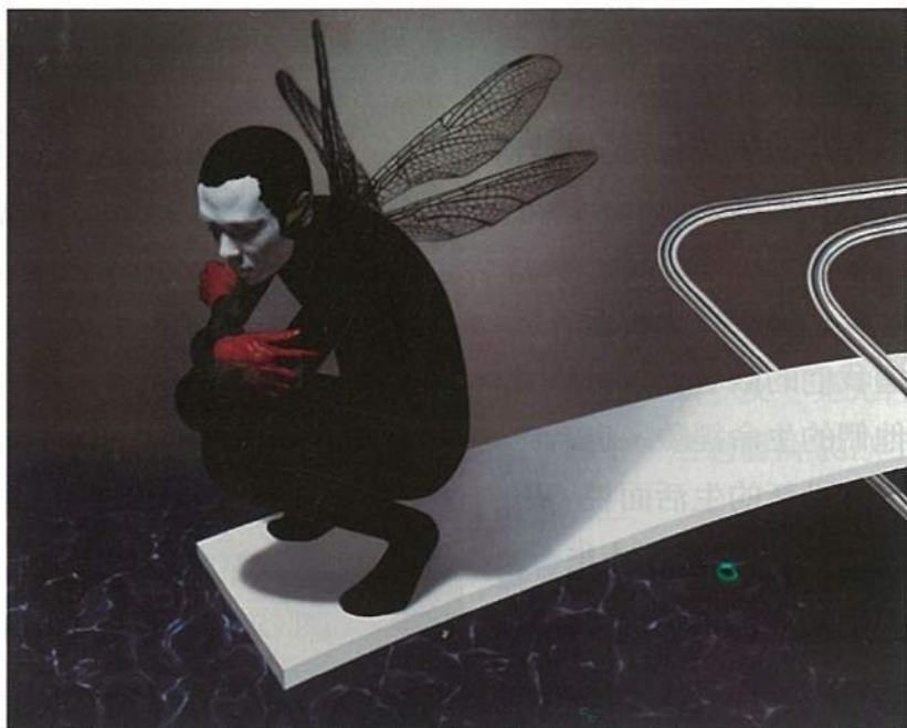
林宏信 迴身之地 I 2012 油彩壓克力畫布 182×227cm

創作於巴黎的藝術家王建文則帶來新作〈Rhapsody in Blue〉，取蓋希文的〈藍色狂想曲〉為名，如同交響樂一般去呈現調和之美，在畫面上嘗