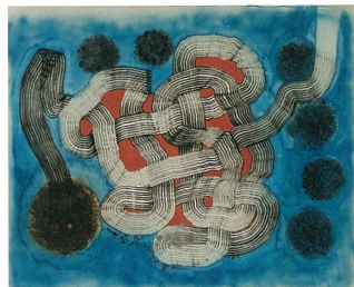
從上至下： 李錫奇老師（左）與尊彩藝術中心負責人余彥良（右）。 廖修平老師（左）與尊彩藝術中心負責人余彥良（右）。 楊英風《有容乃大》，107×68×33.5 cm。 梵戈《吾道一以貫之》，壓克力、水墨、布，148×187 cm，1997。