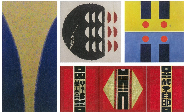
左 蕭勤《神光》，壓克力、畫布，300×150 cm，2008。 中 陳庭詩《晝與夜#11》，版畫、紙本，93×93 cm，1972。 右 霍剛《承合 3-1.3-2》，油彩、畫布，107×200 cm×2。 下 廖修平《迎福門一》，壓克力、金箔、畫布，162×422 cm，2010。

險金等，均能媲美美術館級的規模，當時社會大眾為之驚豔譁然，也奠定了尊彩藝術中心帶領台灣美術邁向更精緻、更具權威性的新紀元，這實為私人畫廊少見的辦展模式。2012年尊彩成立二十週年，籌辦名為「彩筆江河」陳澄波大型回顧展，其中更商借了難得一見億萬級的作品「淡水夕照」，如此不計成本為社會大眾所著想的辦展舉動，也是我們一直為展覽的難度與精緻度挑戰的一種熱忱，獲得普羅大眾相當的熱情參與和掌聲。