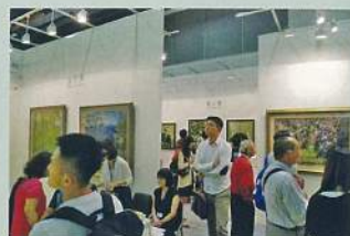
國家世華藝術中心展位，人潮絡繹不絕。