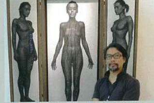
東家畫廊張國權展出常易的作品，在現場全數售罄。