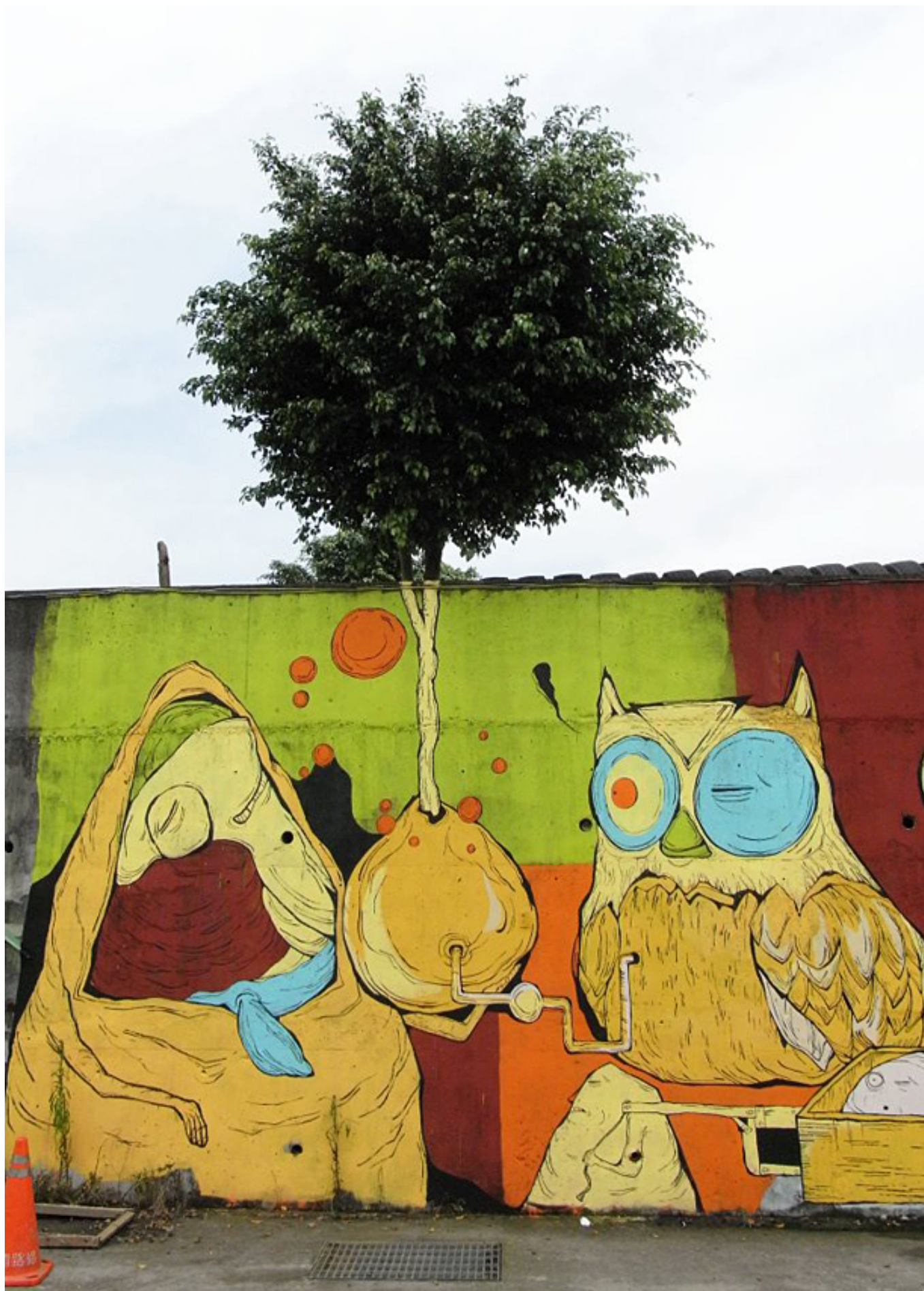
Candy Bird結合現場環境與塗鴉的作品。