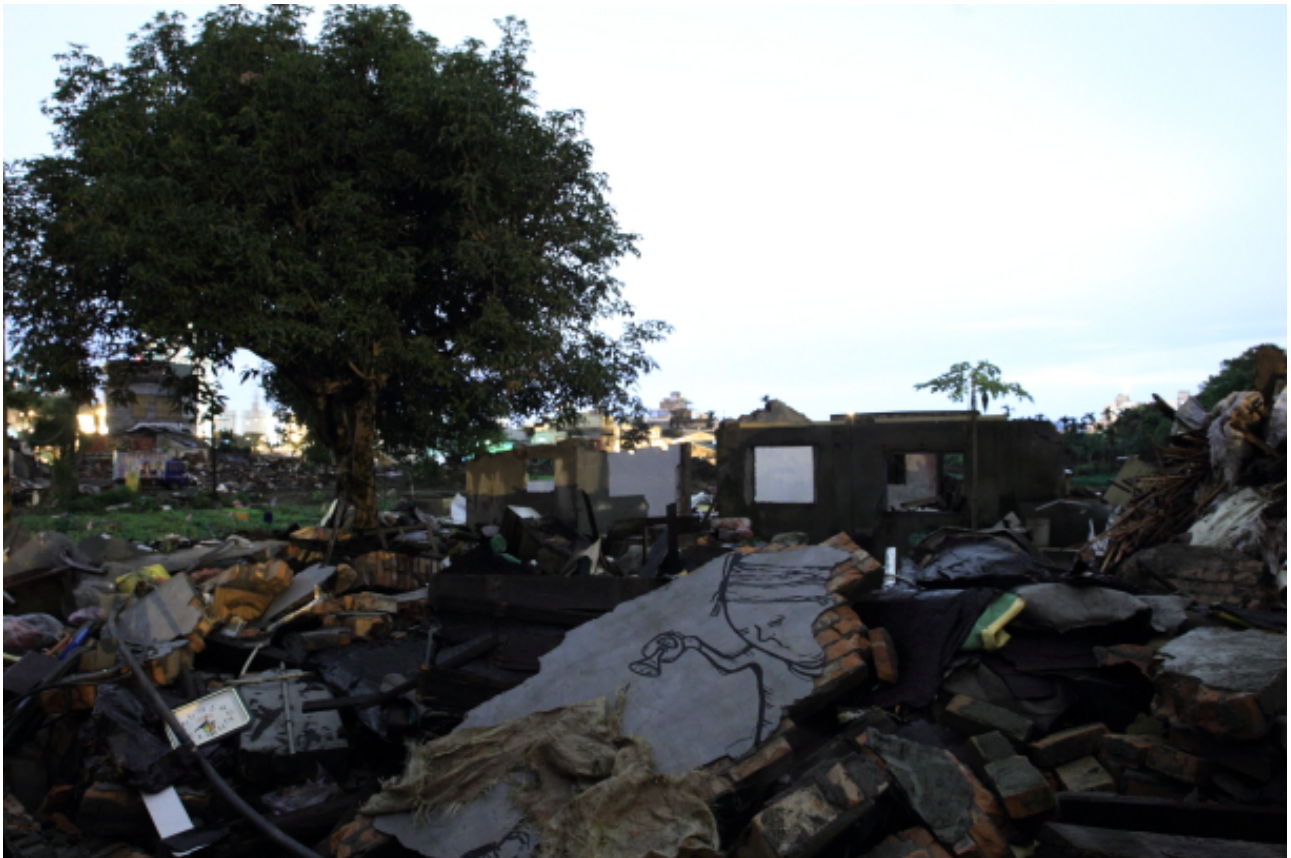
Candy Bird的作品，靜靜地躺在新店十四張的斷垣殘壁中。（2012/01）

雖然我的塗鴉以嘲諷、隱喻的方式比較多，但我也曾經針對過特定對象，用塗鴉去攻擊他。但事後我覺得很後悔，因為因果是會循環的，那樣做只會讓仇恨一直再生，而這不是我想要的。我希望可以用塗鴉，去刺激別人對社會、生活有不同的想法，不過那是理想的狀態。