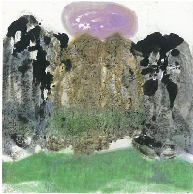
李重重〈望山有情〉 水墨設色、紙本 90.5×90cm 2013