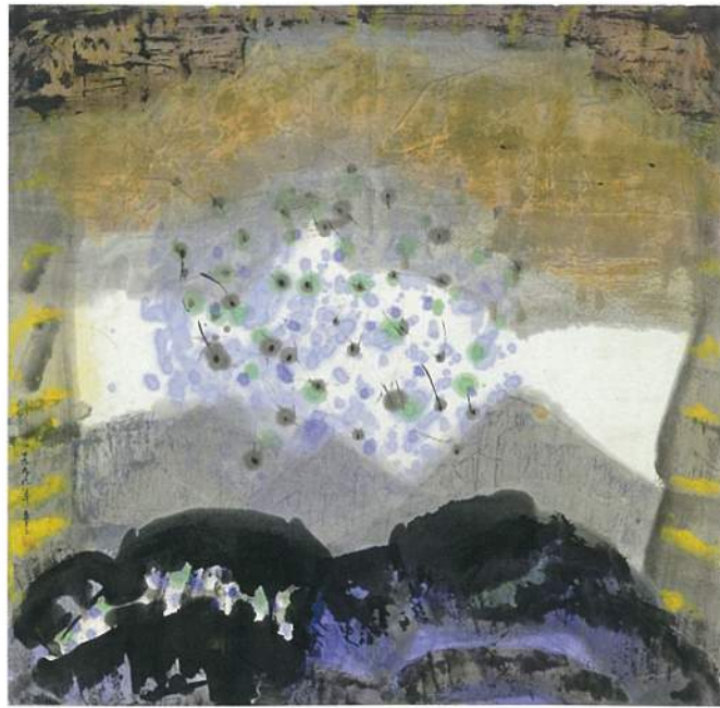
李重重〈外來的訊息〉 水墨設色、紙本 68×69.5cm 1999