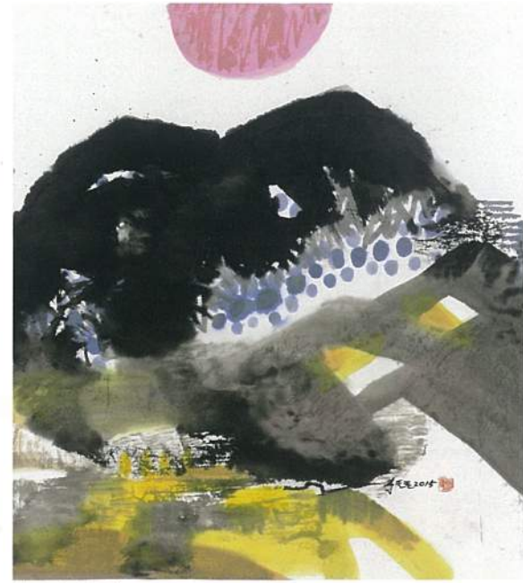
李重重〈遠方〉 水墨設色、紙本 54×48.5cm 2015