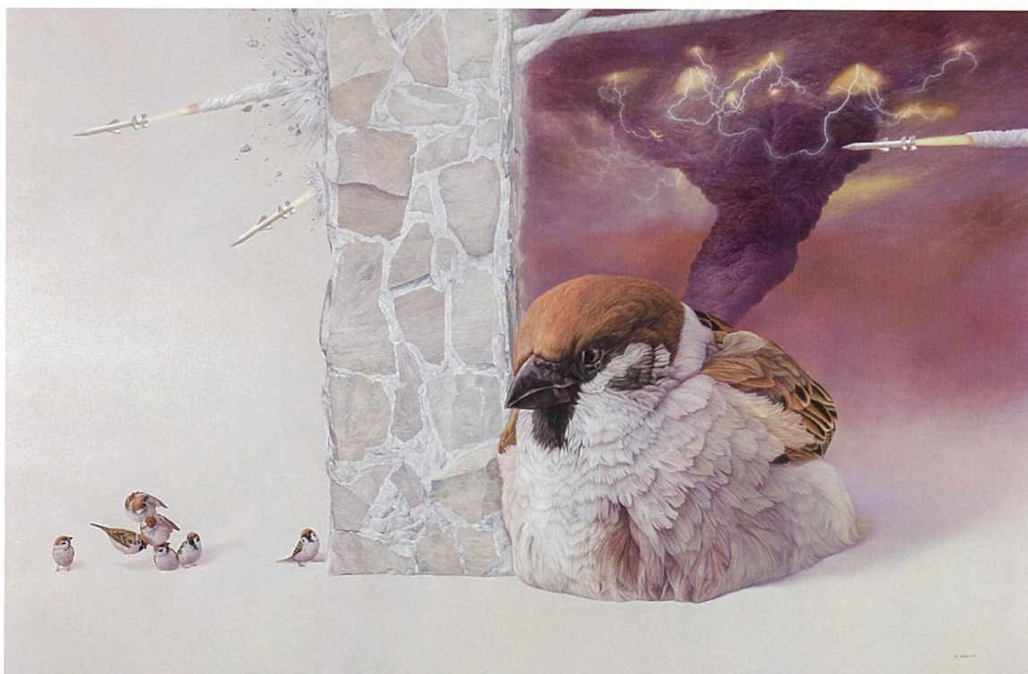
黃頤勝 / 彼岸的希望 / 油彩、畫布 / 115 x 175 cm / 2016

1981年生於高雄的藝術家黃頤勝，畢業於國立台灣師範大學美術研究所西畫創作組（MFA）。研習寫實繪畫多年，擅長較為細膩的表現手法，慣用較為平緩隱喻的方式鋪成述說，這些年來黃頤勝主要以「麻雀」做為繪畫主題，近幾年的數次個展中，可發現他在構圖與繪畫語彙上的些微轉變。